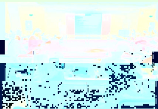
院长主持2010年度学术交流会

院长主持，各院系领导、骨干教师、副教授、讲师、青年骨干教师、青年学术骨干等参加。会议首先由院长致辞，向全院教师致以节日的问候，并充分肯定本院教师在教学、科研、学科建设等方面取得的成就，对全院教师在新的一年中取得更大的成绩表示信心和期待。随后，各院系领导分别就本单位的教学、科研、学科建设等方面的工作进行了汇报。在充分肯定成绩的同时，也指出了存在的问题和不足，并对下一步的工作提出了要求。会议最后由院长总结讲话，对全院教师的工作表示肯定和感谢，并对新的一年寄予厚望。