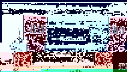
与会领导和教师合影

会议期间，各院系领导还分别就本单位的教学、科研、学科建设等方面的工作进行了汇报。在充分肯定成绩的同时，也指出了存在的问题和不足，并对下一步的工作提出了要求。会议最后由院长总结讲话，对全院教师的工作表示肯定和感谢，并对新的一年寄予厚望。